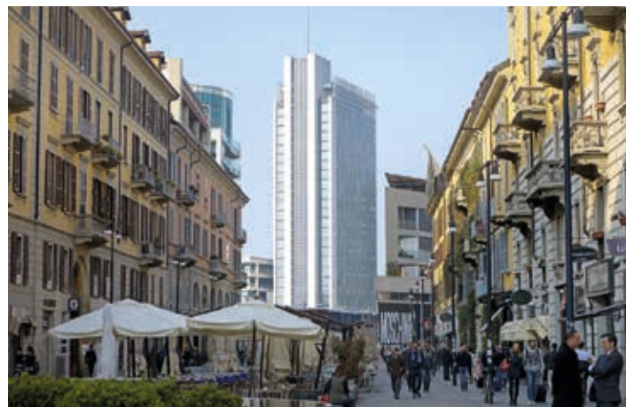
▲ Mediolan łączy stare z nowym – Corso Como

się z tym, czego pragnie przemysł turystyczny. Co godne podkreślenia – takie podejście jest ewenementem na skalę całego kraju.