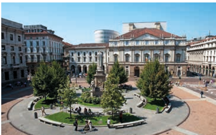
▲ La Scala – najslawniejszy teatr operowy we Włoszech

z prawdziwą pompą. W 1876 r. ukazał się pierwszy numer czołowego włoskiego dziennika „Corriere della Sera”. Szybka industrializacja spowodowała jednak, że robotnicy byli niezadowoleni ze swoich warunków bytowych, co z kolei owocowało licznymi protestami i strajkami.